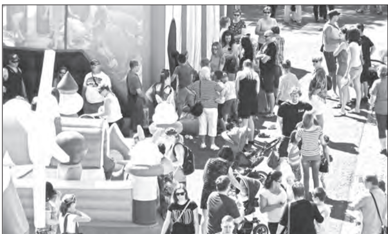
Den otevřených dveří se setkal s velkým zájmem