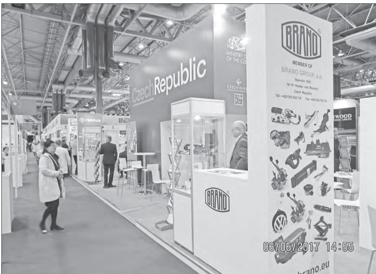
Branecká expozice na společném stánku v Birminghamu