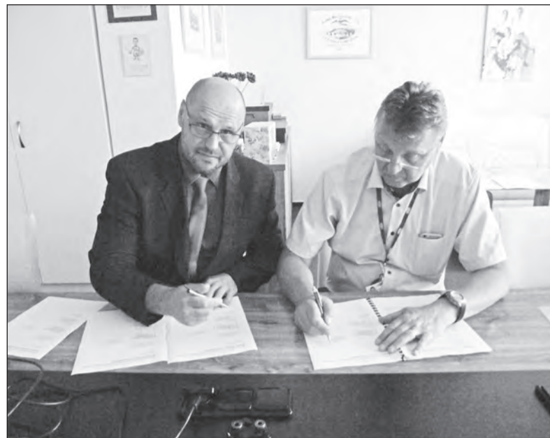
Důležitá část KS je dohodnuta

Koncem června došlo k faktickému uzavření kolektivního vyjednávání o mzdové oblasti platné kolektivní smlouvy v BRANO a.s. Mzdová oblast Kolektivní smlouvy 2016-2019 byla podepsána zaměstnavatelem a zástupci odborových organizací.