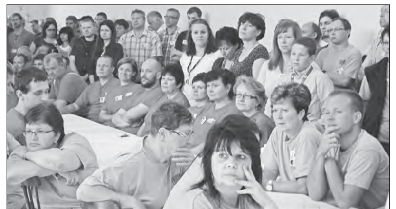
Plná jídelna branečáků