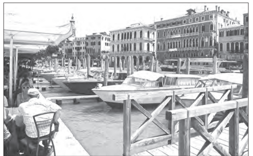
Italské Benátky. U nás parkují auta, tady lodě. Který pohled je hezčí?