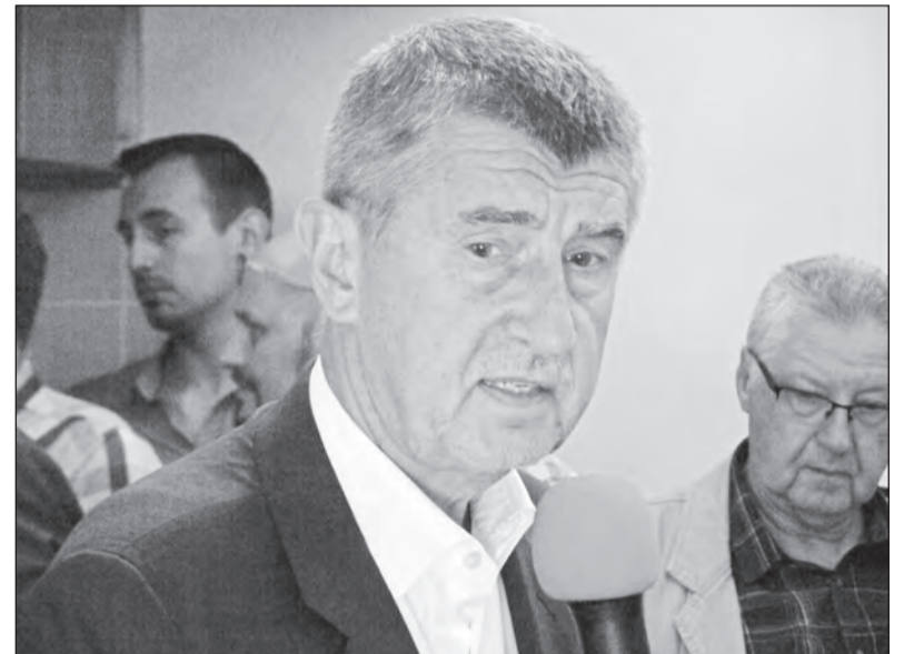
Andrej Babiš promlouvá k branečákům