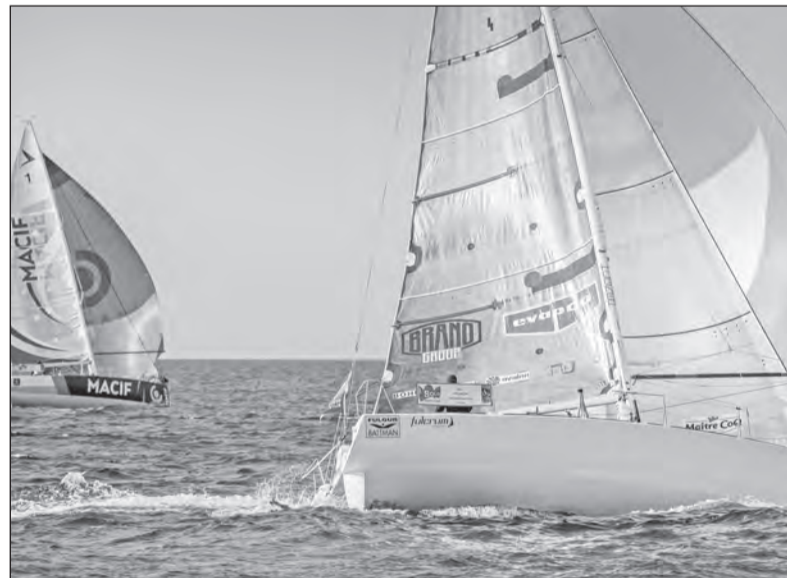
Závodní jachta v akci

Je to první rok, kdy jsem naplno v lodní třídě Figaro. Absolvoval jsem většinu zimní přípravy a tréninky, které běží od listopadu loňského roku. Odjel jsem všechny závody této třídy od března a dnes jsem dojel svůj nejtěžší závod kariéry La