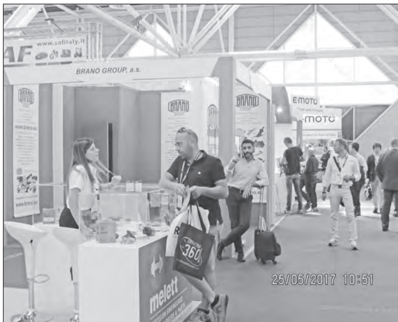
Na veletržním stánku BG v Bologni

Vedení BRANO GROUP přeje všem zaměstnancům pohodu, klid a hodně sluníčka během letní dovolené